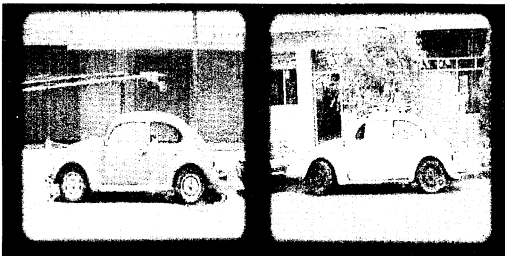
"STILL", 2006. Animación 2D/compuesto, de Jens Kull.