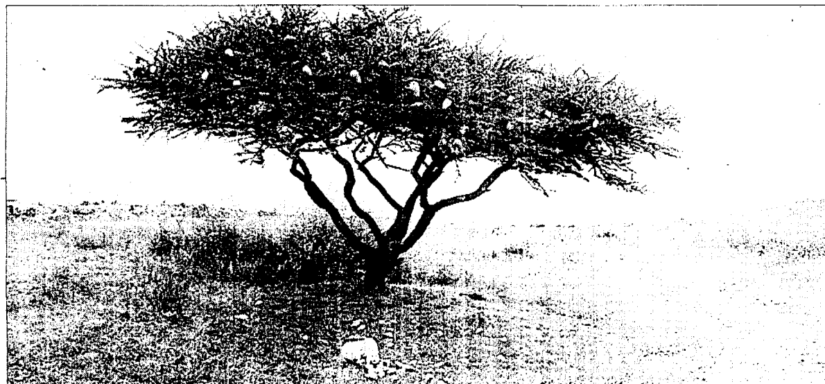
"ARBOL de tunas", 2006. Impresión cromógena, de Adela Goldbard Rochman.